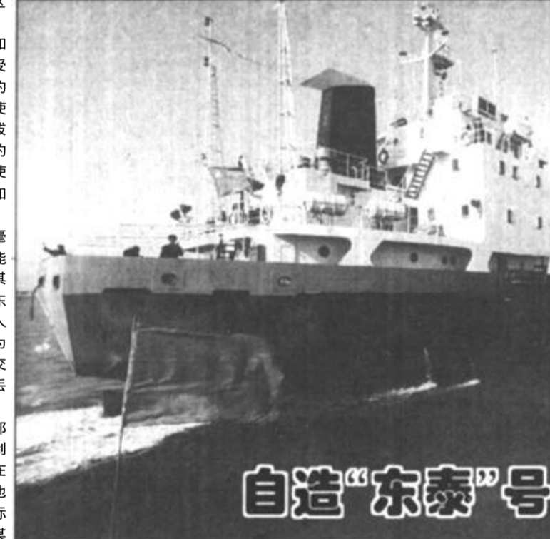
自造“东泰”号远航日本

东营区以实绩提拔任用干部 本报讯 不久前，东营区委、区政府对个别工作懈怠、不思进取的干部进行了降职和调职安排；对4名曾经出差受过降职处理但现在进步很大的干部，在职务上给予了提升使用。他们实事求是以实绩提拔任用干部，调动了受过处理的干部和其他干部的积极性，使少数想坐“铁交椅”的干部增加了危机感。 在其位不谋其政，工作毫无建树，就让他下来；把有能力、有热情的干部放到适合其施展才干的位置上来。这是东营区新一届领导班子重用能人的共识。过去，一些干部自认为一提拔就等于坐上了“铁交椅”，只要不犯大错就不会丢官，因而工作平庸，不思进取。对此，东营区在今年考察干部时明确提出，打破旧的用人制度，即使过去有过差错，但现在实绩突出的干部照样重用。他们制定出干部岗位责任制标准，严格按照标准进行考核。某公司经理“不求有功，但求无过”，本单位亏损状况一直未能改变，区里果断将其降为普通工作人员。一名正科级干部因工作失误被降职后，不气馁，积极工作，虚心向人求教，大胆开拓奉献，实绩突出，根据他的现在表现，党委重新把他提拔到另一单位挑重担子。 东营区的这一做法，有力激发了